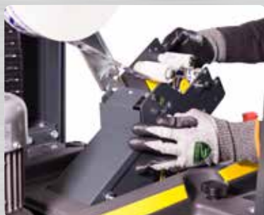
Zeitsparende Lösung - der schnell abnehmbare Verklebekopf

* Mit oberen Andruckwalzen (verarbeitbare Mindestbreite 205 mm) Obere Führungen bei einer Kartonbreite von unter 205 mm erforderlich (optional)