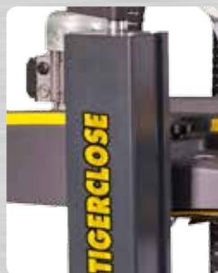
Grosse Zuverlässigkeit, robuster Rahmen