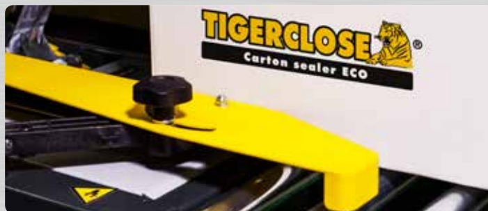
Perfekte Einstellung über die Seitenführungen, obere Leerlaufrollen und zusätzlich 4 obere und untere Transportbänder